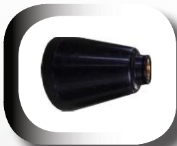
Tromblon permettant de cibler la base du feu.