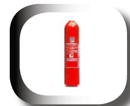
Bouteille forgée en acier léger à 250 bars, selon directive des appareils sous pressions 97/23/CE